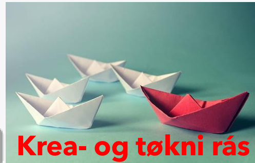
Krea- og tøkni rás