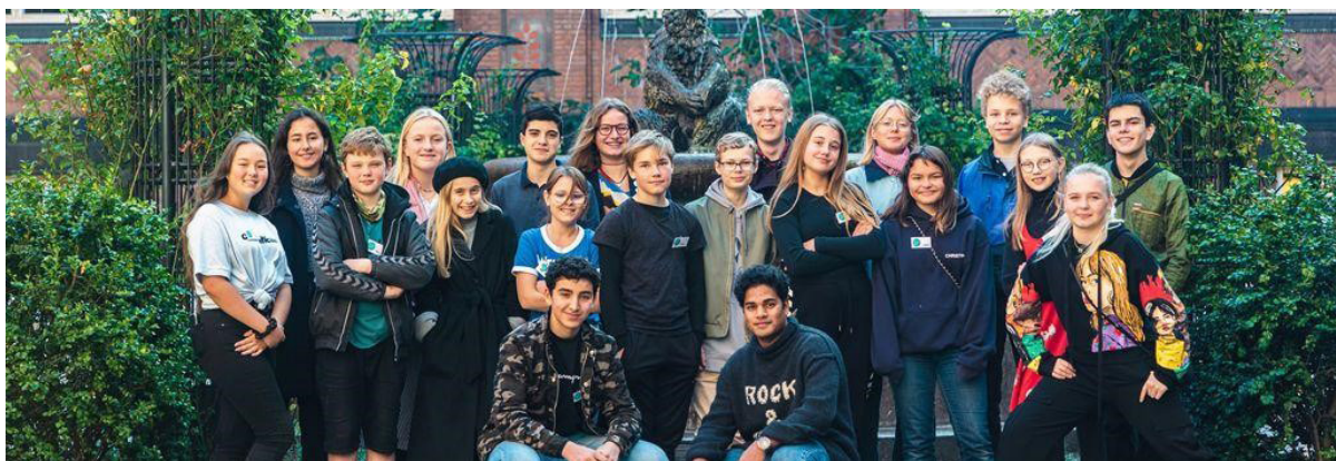
Ungeråd 2020 nyhed

Brot úr Ud og se hjá DSB liggur á fram-síðuni saman við uppgávuni undir ”fyliskjøl”